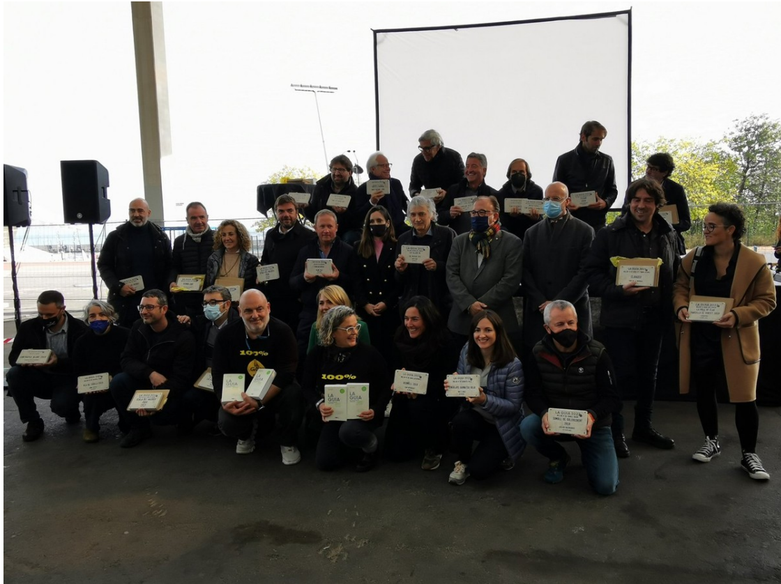
Premiats de l'edició 2022. | Guia de Vins de Catalunya.

Tres vins escumosos han estat els vins millor puntuats a l'edició d'enguany.