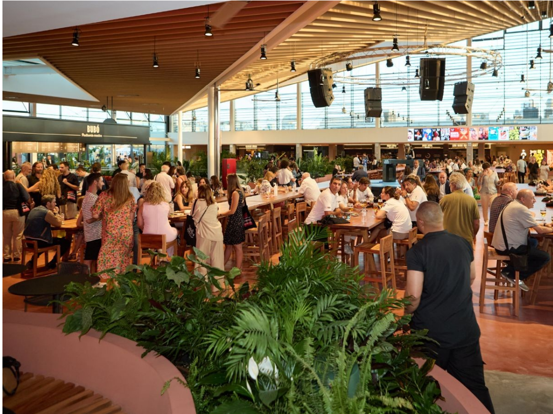
Gent durant la inauguració del Time Out Market Barcelona.